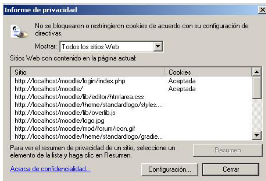
FIGURA 2. Internet Explorer – Informe de Privacidad

Acceda a la opción Informe de Privacidad disponible en el menú Ver . Esto desplegará una pantalla similar a la que se muestra en la Figura 2, donde debe hacer doble clic sobre la dirección del sitio correspondiente a Unpabimodal que en su pantalla aparecerá como http://200.51.43.210/moodle .