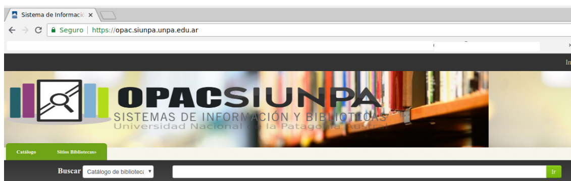
Figura N.º 1 - Ingreso al OPAC

Una vez en esta pantalla deberá dirigirse al sector derecho para ingresar su usuario y contraseña