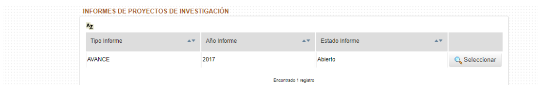
Imagen 5: Informe de avance habilitado para la carga.

En primer lugar, seleccione el Informe de Avance/Final que desea cargar. A continuación, se mostrarán una serie de secciones, que deberá completar una por una.