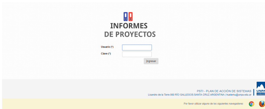
Imagen 1: Pantalla de inicio de sesión.

Si los datos ingresados son correctos, y el Proyecto de Investigación se encuentra habilitado para la carga de Informes, se mostrará la pantalla de Inicio. Por otro lado, si los datos son incorrectos o el Proyecto no se encuentra habilitado, se mostrará el siguiente mensaje: