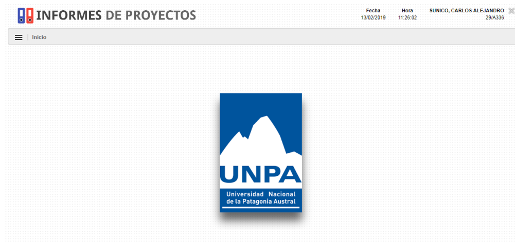
Imagen 4: Pantalla de Inicio

Una vez que ingrese al sistema, se presentará la siguiente pantalla: