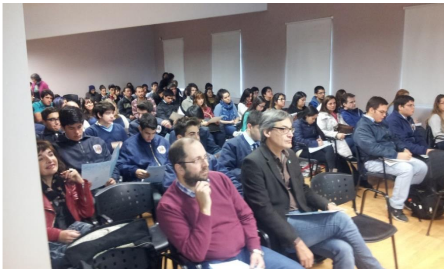
Concurrencia durante los bloques de la mañana de la 1ª Jornada ITA

La estructura de la Jornada se dividió en cuatro Bloques, cuyas temáticas se muestran en la figura siguiente, a efectos de agrupar las presentaciones por temas afines. Al final de cada bloque se realizó una sesión de preguntas del público a los expositores presentes.