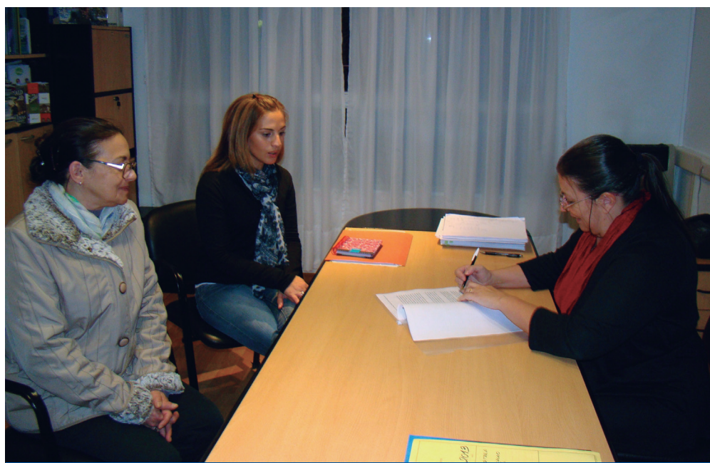
Firma de Convenio entre la UNPA y el Ministerio de Trabajo.

Todas las actividades se ejecutarán desde la Secretaría de Extensión de la UNPA.