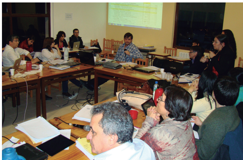
Reunión de Consejo Superior de la UNPA en Río Turbio