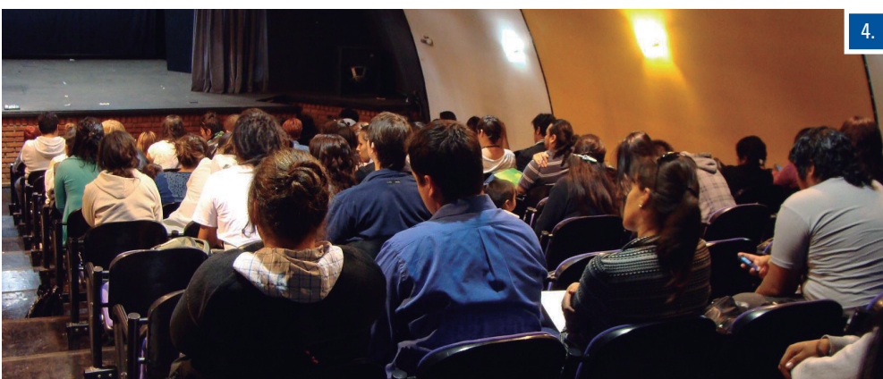
/1. Jornadas "Ser estudiante en la UARG" /2. Proceso de inscripción en la UACO /3. Curso introductorio en la UASJ /4. Masiva concurrencia al curso introductorio dictado en la UART.

En el caso de la UARG, donde la matrícula de ingresantes superó los 800 inscriptos entre las 21 carreras que conforman la oferta de grado de esta unidad de gestión -manteniendo el nivel de los últimos años-, las autoridades destacaron un "crecimiento exponencial" de alumnos nuevos en las carreras de Ciencias Sociales.